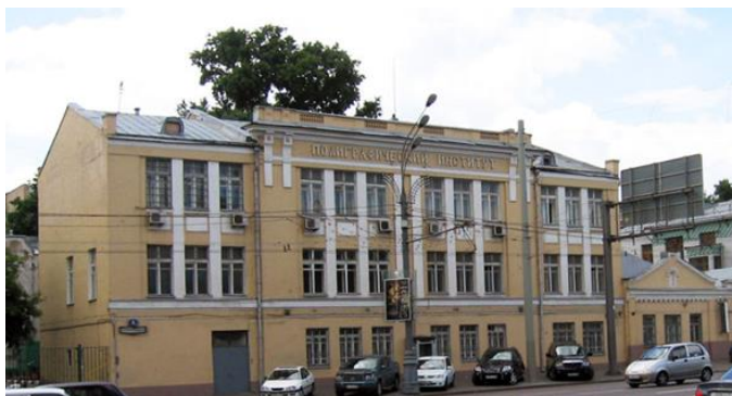
Дом С.И. Мамонтова (сейчас - Московский полиграфический институт)