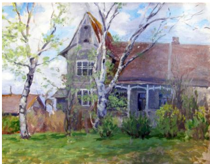
Е.А. Бялыницкая-Бируля «Чайка»