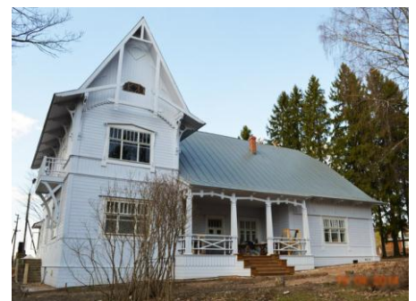
Дача «Чайка», 2015 г.

3. Сообщение «Путешествия ОИРУ в 2016 году» (Россия и ближнее зарубежье).