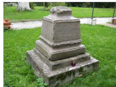
Памятник А.И. Гудовичу

Выступления сопровождаются показом фотоматериала. Фото предоставлены докладчиками.