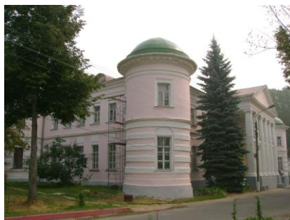
Главный дом усадьбы