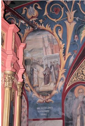
Росписи в Никольской церкви