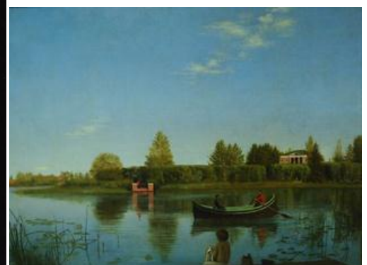
Г.Сорока. Островки. Тверская картинная галерея

Адрес: Государственный Музей Архитектуры, ул. Воздвиженка, д.5/25, Лекторий, 1 этаж Ст.м.: "Библиотека им. Ленина", "Арбатская", "Александровский сад", "Боровицкая".