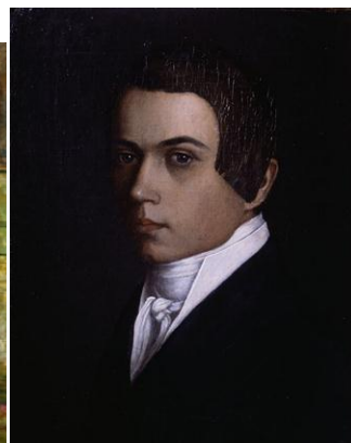
Г. Сорока. Автопортрет