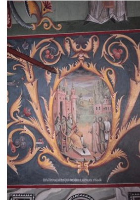
Росписи в Никольской церкви