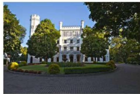
Стара Весь. Замок С.Г. Голицына

Адрес: Государственный Музей Архитектуры, ул. Воздвиженка, д.5/25, Лекторий, 1 этаж Ст.м.: «Библиотека им. Ленина», «Арбатская», «Александровский сад», «Боровицкая».