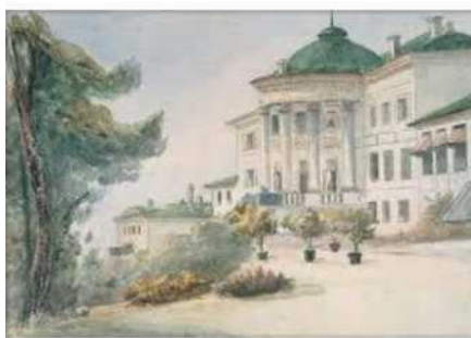
Зубриловка. Усадьба кн. Голицыных