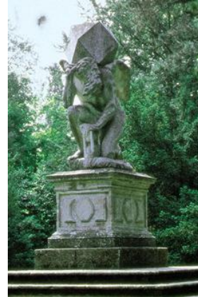
Вилла Барбариго. Статуя Хроноса