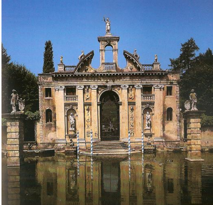
Вилла Барбариго. Врата Дианы